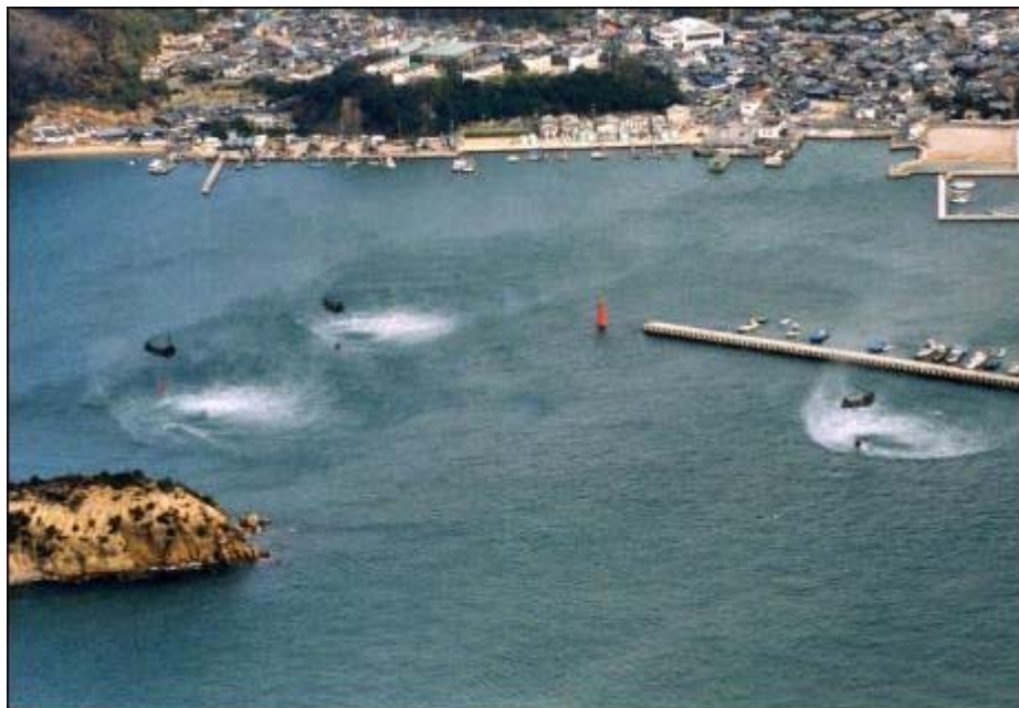
（同時に汲水する CH47 - 3 機@香川県直島の港）