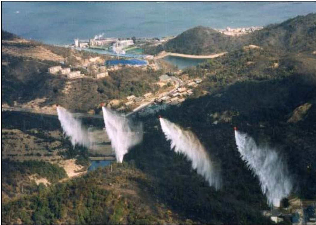
(香川県直島の山林火災に活躍する4機のCH47)

火事を消すには水が要る。 CH47ヘリコプターは1時間に160トンもの水を搬送し投下する。 大震災時の初期消火活動はヘリコプター以外に考えられない。